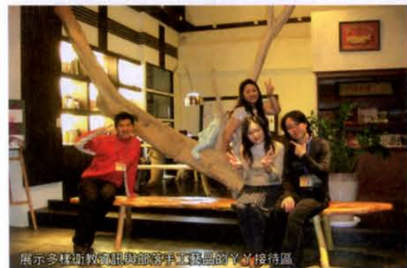
展示多樣術教職與部客手工藝島的Y接待區

台東最豐富的人文資源在於多樣化的族群，而不同族群都各有特殊的文化風俗，是最能吸引觀光客的誘因。觀光，比的不是五星級大飯店的設備，而是當地的人文藝術，印尼的巴里島、西藏、不丹、印度、希臘無不如此。人文藝術如何產生最大的功效，大陸的「印象 劉三姐」是一個很好的例子，藉由一齣大型的山林歌舞劇，讓當地務農的民眾於農忙後，晚上都來充當臨時演員，把活動的場子作大，以聲勢取勝，數大即是美，即有不可取代的強烈感動。不但農民增加了收入，也帶動了地方經濟，傳承了地方的文化。文化資產是最能產生附加價值的產業，台東地區的歌唱舞蹈表演團體目前都是遊走在各大飯店，人數少、表演亦不夠專業，再說原住民舞蹈關在冷氣房裡，與在群山環繞的大自然中高聲歡唱，那是完全不一樣的感受。飲食、手工藝等部分亦是如此，當然這得考慮到整體產業的配合。此處應設法整合民間與政府資源。