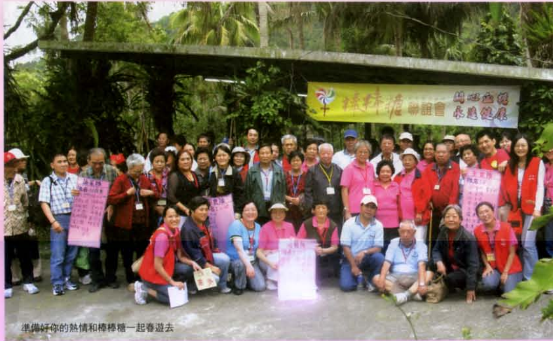
準備好你的熱情和棒棒糖一起春遊去

4月27日我們帶著兩家醫院近百名的糖尿病友於一起出遊，當天來了三家醫院總共六位營養師、三位醫師，陣容空前壯大，幾乎台東地區的各大醫院都有派人前來觀摩（或許因為我們是全國第一名的團體吧）。林教授特地為大家開講胰島素的相關知識，我們也特別請藥廠提供獎品，送給願意體驗打胰島素的病友，沒想到施打率竟高達八成。大家高高興興地拿著獎品說：「真的都不痛呢。」另外我們還以小隊為單位，請各隊學員合力將隊長買來的食材煮成10份菜餚，各隊學員分工井然，在克難的條件下大顯身手，煮出一盤盤色香味俱全的菜餚，互相觀摩學習，並聽取營養師的綜合建議。最後葉會長以聖母醫院的經驗鼓勵其他醫院趕快成立糖友團體，嘉惠更多糖友及其家庭。