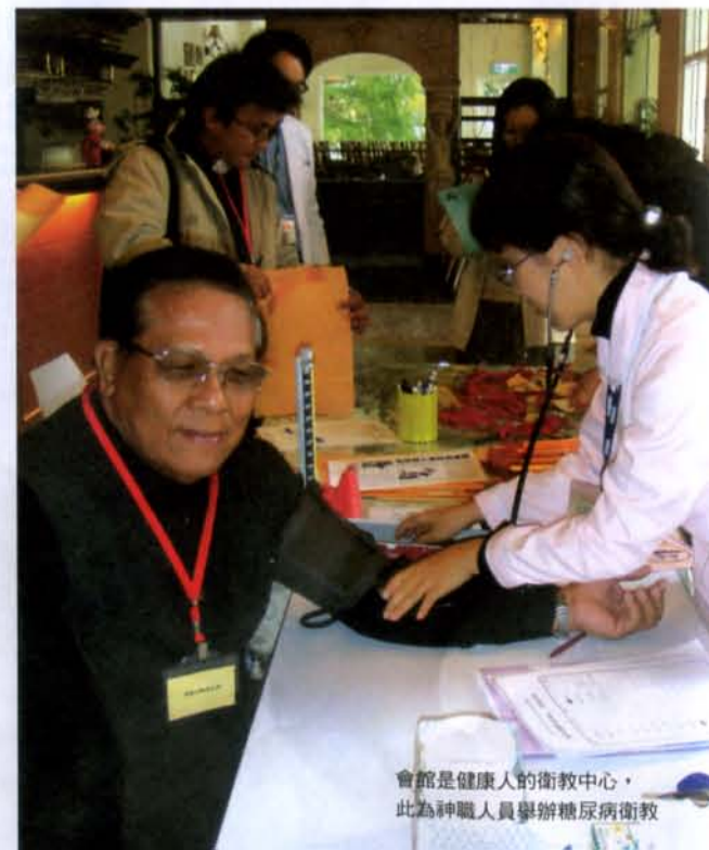
會館是健康人的衛教中心，此為神職人員舉辦糖尿病衛教