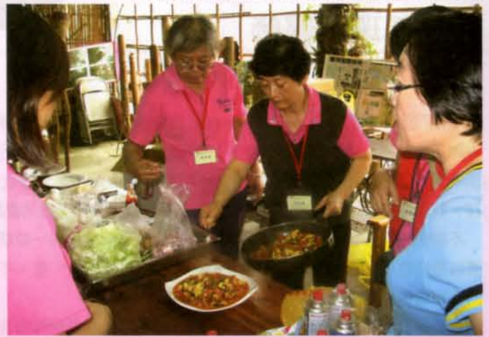
參加活動的學員們大顯身手，烹調出一道道美味又營養的佳餚