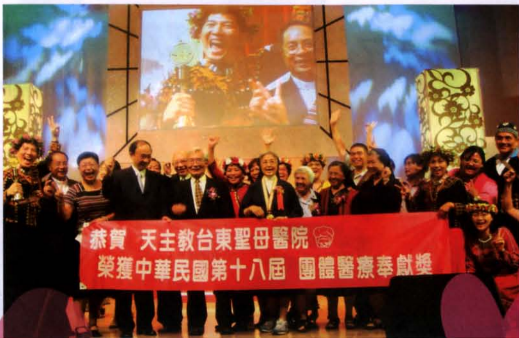
恭賀 天主教台東聖母醫院 榮獲中華民國第十八屆 團體醫療奉獻獎

今年6月28日(週六)，台東聖母醫院大陣仗出動20餘人來到台北接受第18屆醫療奉獻獎的團體獎殊榮；具有人文指標意義的醫療奉獻獎著眼「奉獻」二字，強調醫療「典範」，評審表示今年審核十分嚴格，得獎者的數目是歷屆以來最少的，由於它獎勵「奉獻」而不是「貢獻」，因此報名的大人物很多，但並不符合奉獻的精神，在初評、實際考察、複評及至最後選出得獎者，不少獲獎人是在討論後產生，但對於聖母醫院在台東後山超過半世紀的奉獻，則眾望所歸在第一輪即無異議通過。