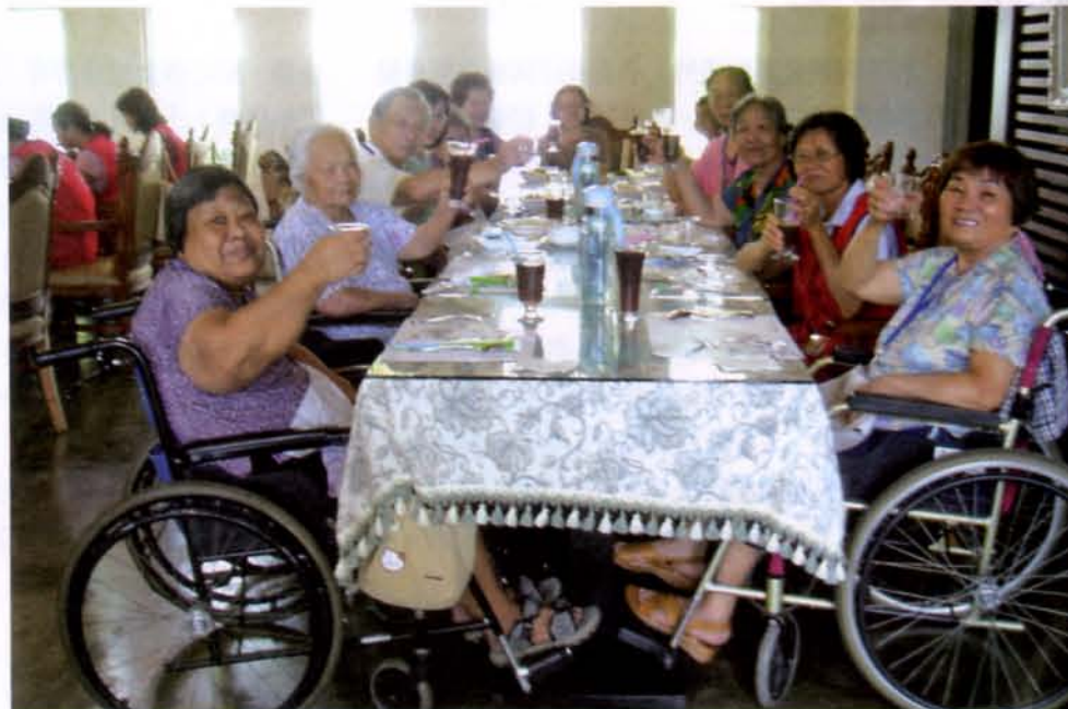
▼我們邀請老人家到會館吃飯，他們一開始還不好意思進來，直說太漂亮了

身體健康的促進可以藉由衛教使個人觀念的改變，或藉由團體的相互砥礪來達成。心理的健康若有精神科的專業團隊加入，結合上述的文化藝術治療與良好的家庭關係與社群關係，效果勢必更佳。至於靈性的部分，需要陪伴與帶領，目前天主教團體將推動各醫院有牧靈團體，將投入人力培訓專業人員，