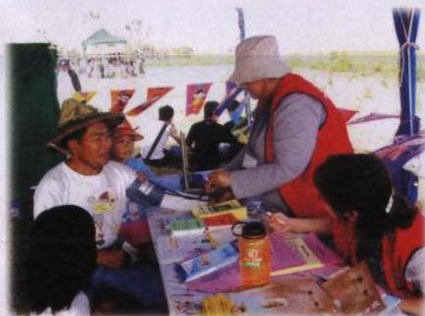
社區健康諮詢活動