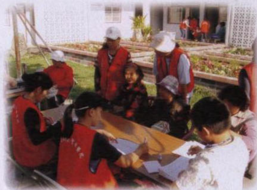
下鄉社區義診服務