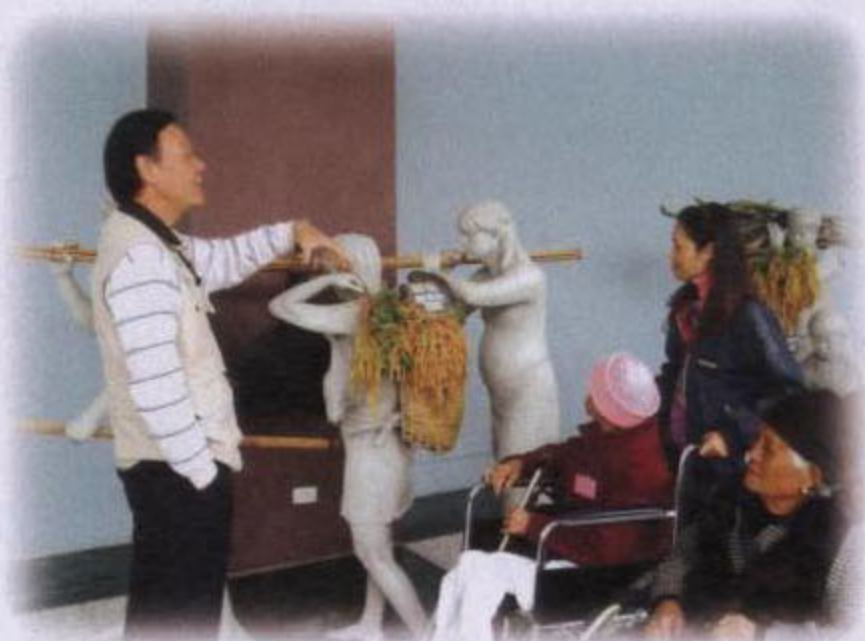
失能老人文康戶外活動