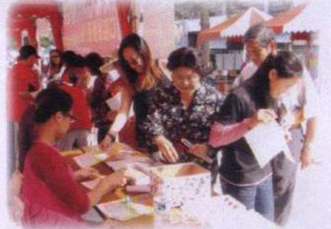
園遊會宣導安寧緩和資訊