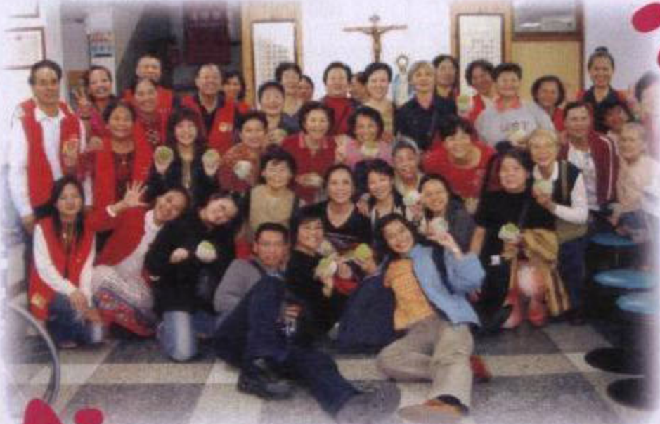
榮總大德病房志工參訪