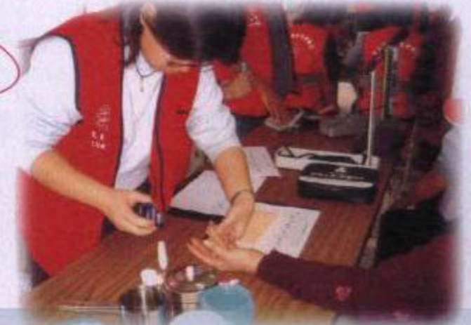
社區服務~池上鄉大坡國小