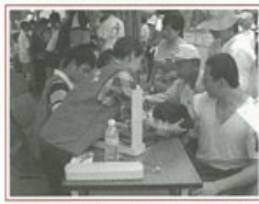
▶ 活動中免費為參加民眾測量血壓與血脂

上午八時三十分舉行簡單的開幕儀式後，鄭雲院長特別感謝社會各界給予聖母醫院的支持與協助，劉副縣長則表示，聖母醫院是許多「聖母寶寶」的家、台東人的好鄰居，希望它未來五十年、一百年繼續跟台東人站在一起，共同守護著台東人的健康。立法委員黃健庭呼籲社會大眾關心聖母醫院，多多協助聖母醫院安寧的建立，他在立法院也會持續來協助。