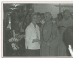
▶ 慈濟證嚴上人來訪，關心安寧病房啟用

花蓮慈濟證嚴上人在五月二十三日前來本院拜訪，並瞭解剛設立的安寧病房情況。本院全體員工對於上人的造訪表達熱烈歡迎及感謝，也希望能與慈濟醫院、大學及護專有更密切的合作交流與學習，上人表示願意來協助與支持。