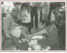
▶ 傳愛路跑活動中免費為民眾測量骨質密度，及早預防及早治療