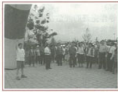
▶ 劉權豪副縣長與貴賓鳴槍開跑

為傳遞聖母醫院關愛全民的理念，秉持「健康守護」精神，本院特別在五月二十四日，結合台東縣政府衛生局、教育局、農業局、環保局、縣警察局、國泰人壽、台東鄉魯灣通運公司、大潤發台東店及台東縣溜冰運動委員會等單位共同協辦，並委託台東縣體育會鐵人三項運動委員會辦理「傳愛路跑」系列活動，結果獲得熱烈迴響，計有三百餘人報名。副縣長劉權豪除了主持鳴槍儀式外，並親自帶領大家全程跑完四公里，他希望聖母醫院能永遠共同守護著台東人的健康。當天，立法委員廖國棟、黃健庭、縣議員張國洲、謝明珠、台東日光寺、澄澄法師、妙健法師等貴賓也蒞臨參與。